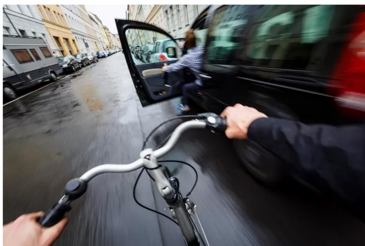
▲ Een vrij alledaags beeld: fietsers knallen relatief vaak tegen openzwaaiende autoportieren aan.