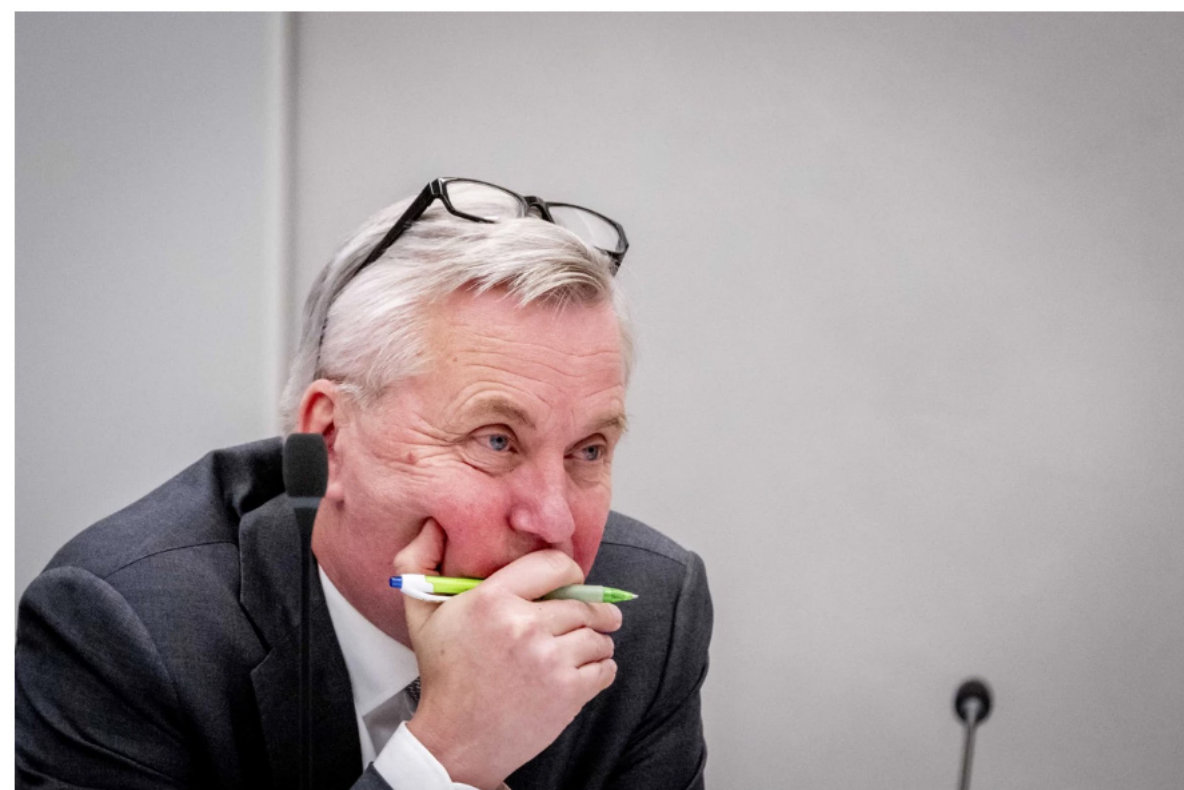
Demissionair staatssecretaris Eric van der Burg (Asiel en Migratie, VVD) tijdens het Kamerdebat over asiel.

Dinsdag verschijnt deze 'capaciteitsbehoefte' in de Staatscourant , maar staatssecretaris Eric van der Burg (Asiel, VVD) verklapte het aantal opvangplekken dat 'op landelijk niveau' moet worden gerealiseerd maandagavond al tijdens een Kamerdebat over asiel.